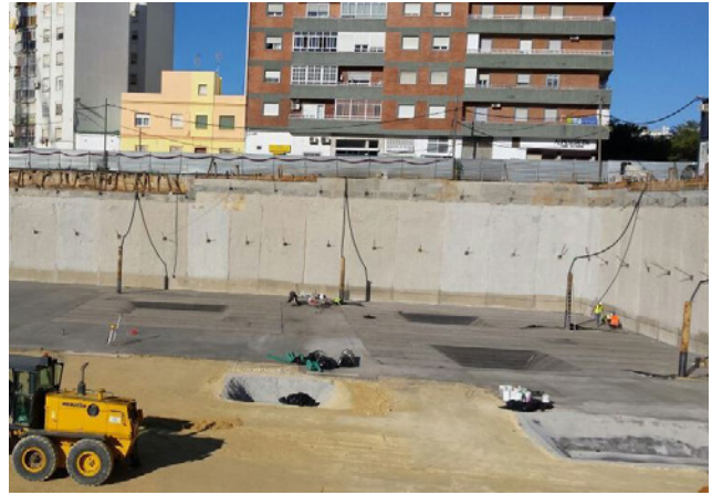
Construcción a un metro por debajo del nivel freático

Para más información sobre nuestros productos y servicios para aplicaciones de achique/dewatering, visite sulzer.com .