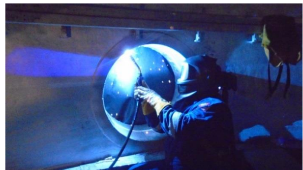
Imagen 3: Reparación de boquillas en sitio

Como alternativa podemos reemplazar la boquilla por completo por una nueva boquilla con una metalurgia actualizada por el proceso de Weld overlay, fabricados en nuestras instalaciones y luego instaladas por nuestros equipos de servicio de campo