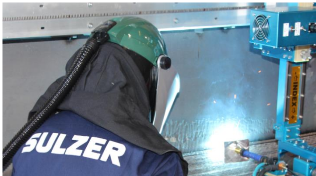
Imagen 1: Weld Overlay Automático en sitio

La utilización de equipos de soldadura automatizada avanzada se puede reparar zonas corroídas o erosionadas, aplicando el espesor requerido y mejorando la metalurgia mediante procesos de Weld Overlay, para reducir los problemas a futuro