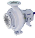
AHLSTAR W 系列 耐磨泵