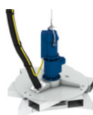
OKI 潜水式曝气混合器