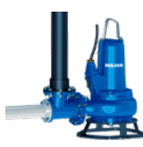
Venturi 喷射式潜水曝气器