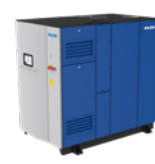
HST™ 磁悬浮离心鼓风机