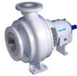
AHLSTAR N 系列 无堵塞泵